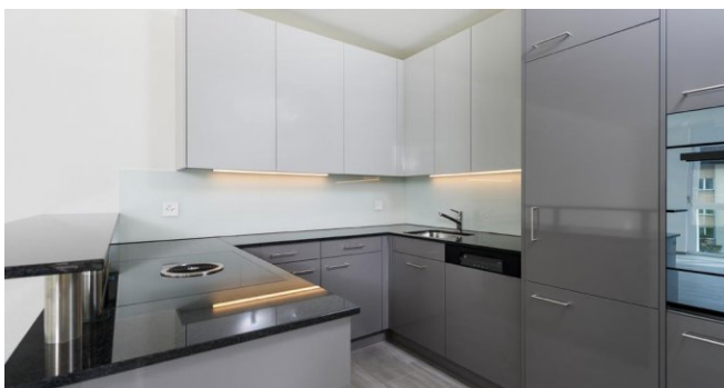
Moderne Küche mit V-Zug Geräten

Telefon +41447878000 Fax +41447878009 E-Mail +41447878000